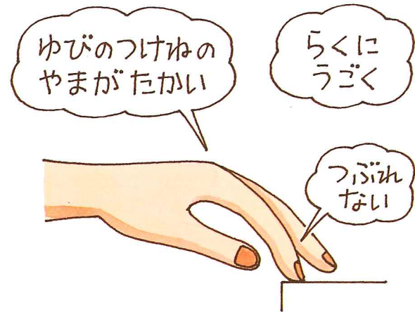
ピアニストのひきかた

「ピアノランド」シリーズでは、指先の鍵盤に触れる面の中心点を「タッチポイント」と名づけ、ピアノを弾く前からその位置を知り、タッチポイントの感覚を鋭敏にすることを提唱しています。まず、タッチポイントの位置を知るために、わざと爪の音やフィンガーノイズのする A B の例を見せて、なぜ C がよいのか違いがわかるように説明してください。 A と B は、指のつけ根の関節よりも指が高く上がるために手にムダな力が入り疲れやすくなります。 A は垂直に打ち込むので固い音に、 B は指先がつぶれてコントロールできないため乱暴な音になりがちです。そこで、爪があたらず、指先がつぶれないタッチポイント C をみつけ、指のつけ根の関節を支点として（山をつくって）ノイズがなく楽に動かすことができる美しいフォームをお手本として見せてください。生徒はこのフォームを目標に 4 以降のメニューに取り組むことになるので、とても大切なところ。違いがわかったら、生徒の手をとって、2 3 4 5 指のタッチポイントに水性ペンなどで軽く印をつけて、メニュー 4 へ進みましょう。